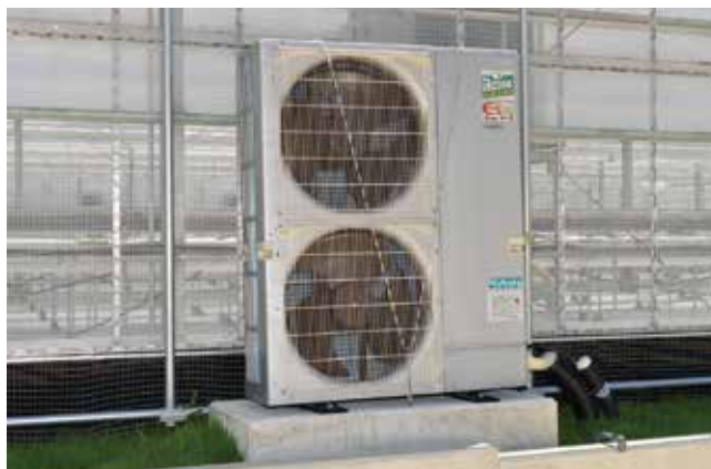
ヒートポンプ空調機(室外機)(3.4kW×6台)