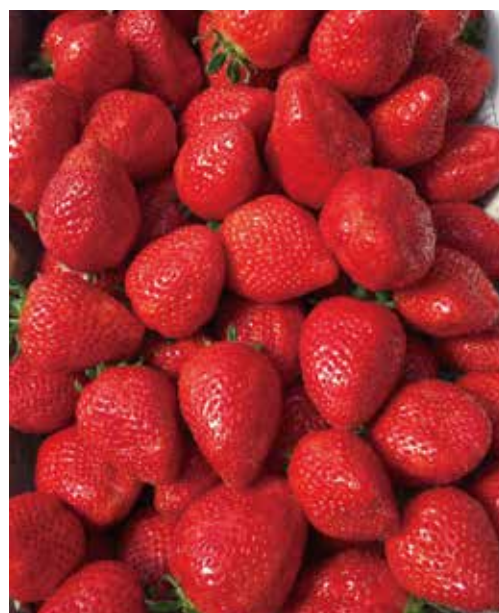
沖縄の太陽、土、水で育ったイチゴはミネラルたっぷり