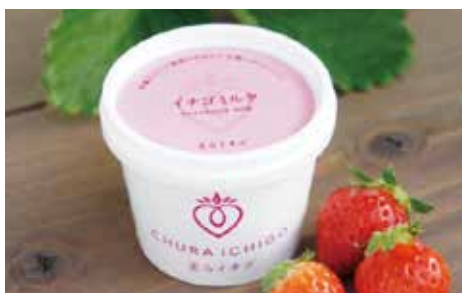
那覇市のアイス店「South & North」とコラボした商品