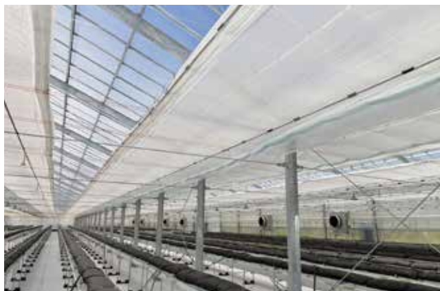
遮光・遮熱・保温カーテン等(0.1 kW×20台)