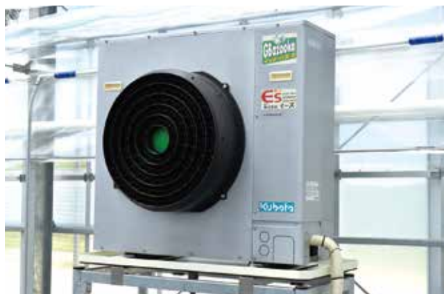
ヒートポンプ空調機(室内機)