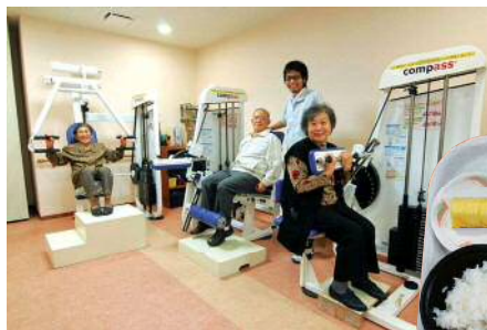
充実の運動プログラムで体力維持・向上を目指します。