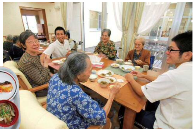
スタッフと一緒にゆんたくしながら楽しい食事。