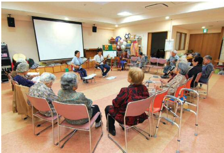
三線に合わせて歌いながら笑顔がるひととき。