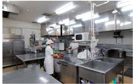
調理時間が短縮され、清潔な環境の中でゆとりをもって調理ができるようになったという厨房スタッフの皆さん。