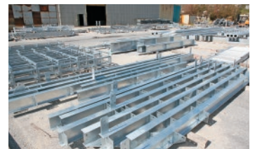
めっき処理された製品の数々

拓南製作所株式会社 ガルバ事業所 〒901-2403 沖縄県中城村字伊舎堂354の4番地