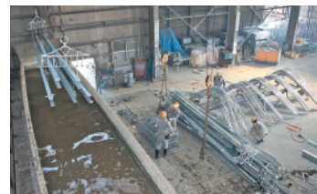
めっき処理後、白サビを防ぐためシリカ槽に浸漬