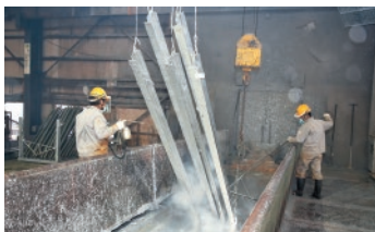
溶融亜鉛めっき処理