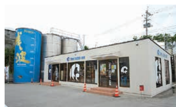
敷地内のショップ外観