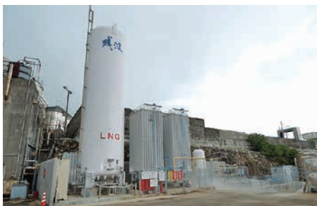
LNGサテライト設備(天然ガス供給設備)