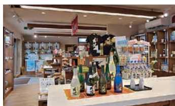
ショップ内に展示された泡盛など