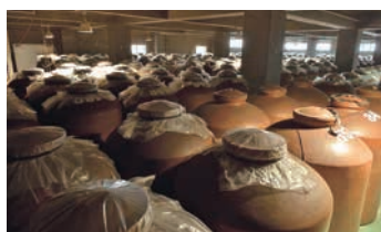
地下倉庫の泡盛甕

有限会社比嘉酒造 〒904-0324 沖縄県読谷村字長浜1061 ☎098-958-2205