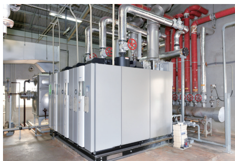
天然ガス焚き高効率貫流ボイラ (2.5t/h×3基)