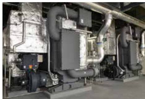
ガス吸収式冷水発生機(1000RT×2台)