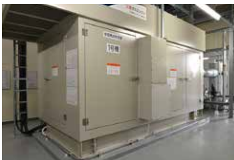
ガスコージェネレーション(380kW×2台)