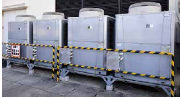
業務用エコキュート