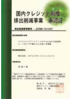
国内クレジット制度 承認証

自家発電機の停止に伴い、業務用エコキュート4台と9m 3 の貯湯槽2基を導入。エコキュートをベースに、既存の温水ボイラーをバックアップとするハイブリッド給湯システムを導入することにより、大幅な省エネ、省コストが図れました。また、設立当時と比べてターボ冷凍機やエコキュートなどの電気設備が増えているにもかかわらず、電気使用量は減少しており、各種省エネ活動の展開による効果が表れた結果となっています。