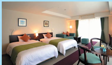
エグゼクティブオーシャンルーム