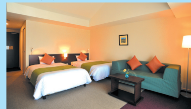
エグゼクティブツインルーム