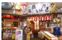
昭和レトロな雰囲気のだ菓子屋コーナー