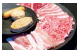
家族みんなで楽しめる「ファミリーセット」