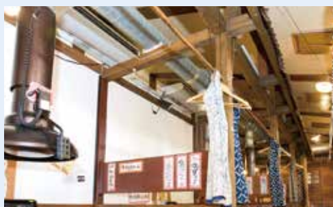
ホール全体を2台の室内機で冷やす。電気空調になり、1台ずつの運転や個別で細かな温度設定も可能になった。