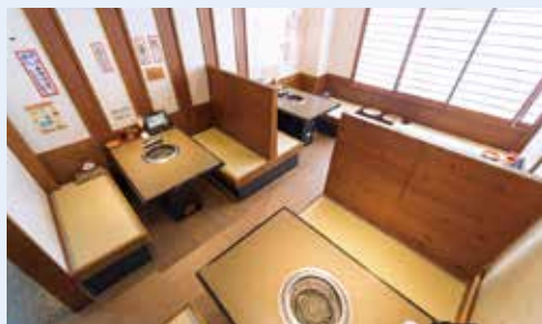
個室では埋め込み式の空調室内機を導入。ガスから電気空調になったことで、各個室ごとの運転や温度管理が可能に。