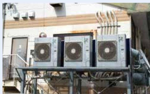
店舗の裏手にある電気空調室外機。