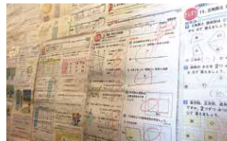
壁一面の100点のテストに、子供たちの笑顔が浮かぶ。