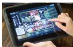
メニューは各席にあるタブレットで簡単にオーダー