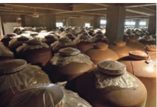
地下倉庫の泡盛甕

ものの、県内で天然ガスを利用している企業はまだ多くない。かえってコスト高になるのではないかと不安もあったという。